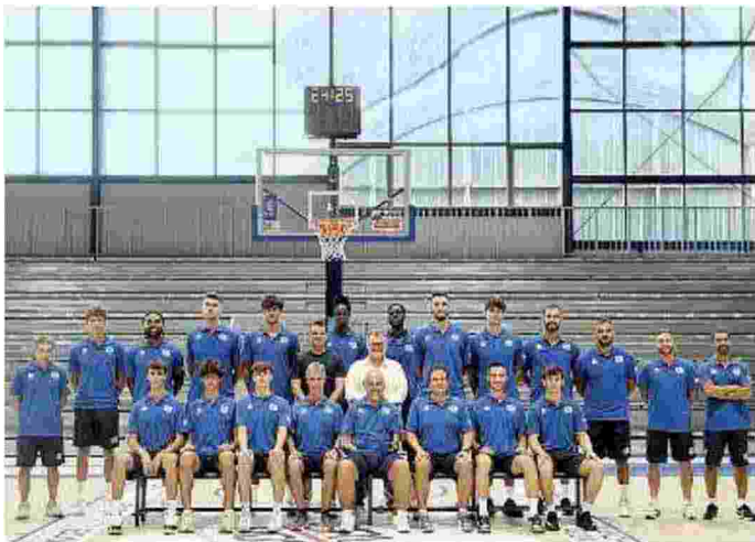
Si punta in alto. Orzinuovi mette nel mirino i play off di serie A2